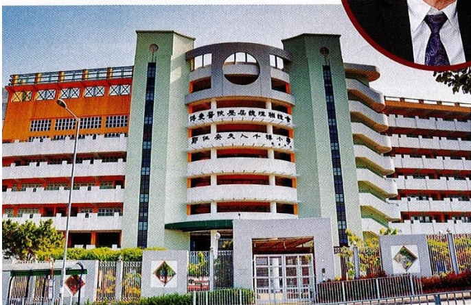
▲鄭任安夫人學校於1985年創校，2003年上下午校轉為兩所全日制小學，下午校遷往屯門掃管笏路新校舍，並轉名為鄭任安夫人千禧小學。