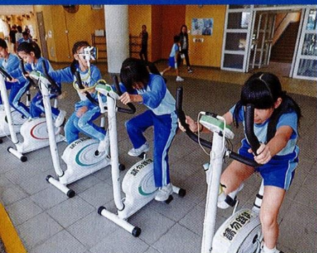
▲不少學生在環保發電單車上大力發功，製造免費電源！