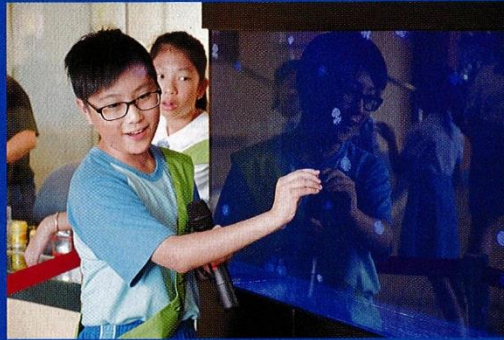
▲學校設有校本水母課程，由環保大使講解水母結構。