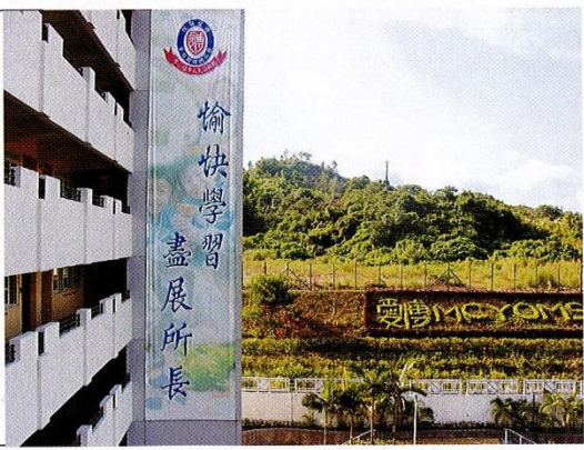
愉快學習 盡展所長是學校的教學理念。

●撰文：Grace Yuen ●設計：Gary