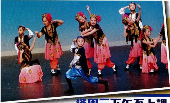
◀中國舞比賽不乏男生參與，圖為男女高級組群舞《陽光照耀塔什庫爾干》。