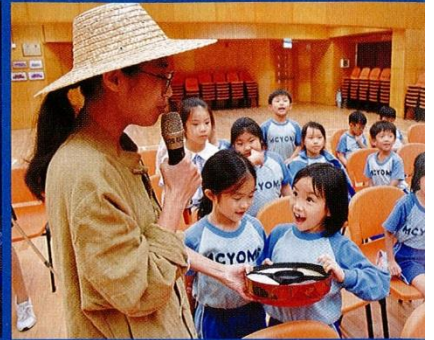
▲每逢中國時節，學校都會舉行華夏文化活動，讓學生了解傳統節日的習俗。