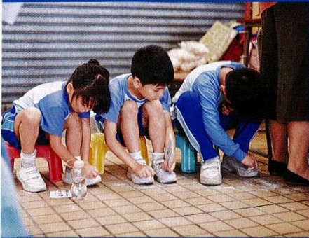
▲學生用墨魚骨清潔白球鞋，實行「污者自潔」的概念。