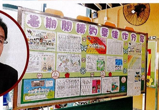
▲學校定期展出學生閱讀後的分享，學生走進校長室分享讀後感，更有機會拿到校長特設的旅遊禮物。