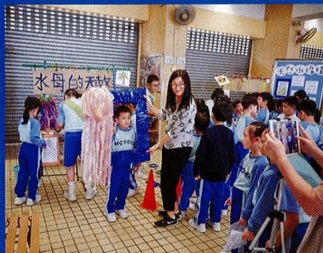
▲擔任環保大使的學生負責設計及製作攤位，攤位以可循環再用的物料為主。