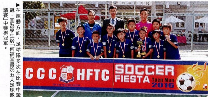
▶在運動方面，足球隊多次在比賽中奪冠，圖為學生於何福堂書院五人足球邀請賽中獲得冠軍。